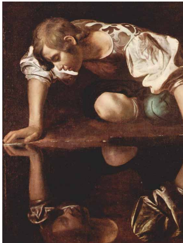
Le Caravage, Narcisse , vers 1597-1599.

Que la conscience ne soit pas une substance mais une relation , cela signifie que c'est par l'activité de la conscience que le monde m'est présent. Husserl tente, tout au long de son œuvre, de dégager les structures fondamentales de cette relation, à commencer par la perception . Il montre ainsi que celle-ci est toujours prise dans un réseau de significations : je ne peux percevoir que ce qui pour moi a un sens.